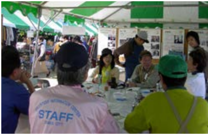
交流サロンで親睦を深める

日頃から地道な活動を続けてまいりました「ふくてっく」は今年7月、誕生して10年を経ました。ふくてっくを力強く祝ってくれるかのような秋晴れの日、10周年記念イベントを思いっきり発信できるステージを迎えました。 1年以上前からいろいろと検討し、開催に向け皆な忙しい中、なんとかやりくりして準備してきたのです。朝早くから現地集合のみんなの顔が生き生きしており、会場の準備も手際よく順調に進行していきま